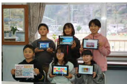
【作成したHPを紹介する6年生】

この単元では、資源や環境を大切にするために自分たちに何ができるか資料を調べ、提案する文章を書いていった。そこで、インターネットや新聞を活用して知識を蓄え、SDGsの大切さを呼びかけるホームページまで作成した。宮崎日日新聞ではSDGsの記事の特集がよく組まれているので調べ活動に最適であった。ホームページ作成の記事を読んだ方からたくさんの反響が寄せられた。一人一人の力は少しでも誠意をもって物事に取り組みれば心と心を通じ合い、波及していくことの素晴らしさを肌で感じる事ができた。