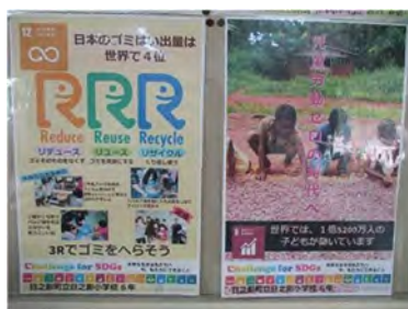
【自分たちで作成したポスター】