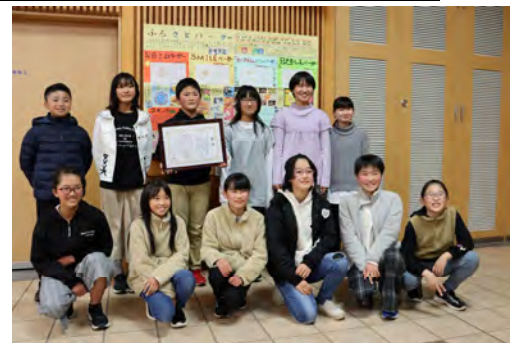
【表彰式での記念写真】

全校で、生活科や総合的な学習の時間で学んだことを壁新聞として作成している。作成の過程では新聞を活用して調べたり、見出しの付け方を活かしたりして作成する。作成した壁新聞は、毎年「食と農」壁新聞コンクールに応募し、いつも素晴らしい結果を残している。心を一つに友達と力を合わせて作りあげた喜びは大きく、次のステップへの自信となっている。