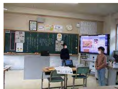
【新聞記事を紹介する児童】

この授業を終えた後も、その力を継続して培うために、「朝日こども新聞」を活用した。タブレットPCを用いて授業の開始5分で、気になるニュースを検索し、友達に1分間で記事を紹介し自分の感想を添えた。そして、友達から質問や意見を受けた。1年間毎日継続して行うことで社会で起こっていることを知識として蓄え、記事を1分間で紹介することで、要約する技能を高めることができた。