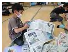
【放課後 NIE タイムの様子】